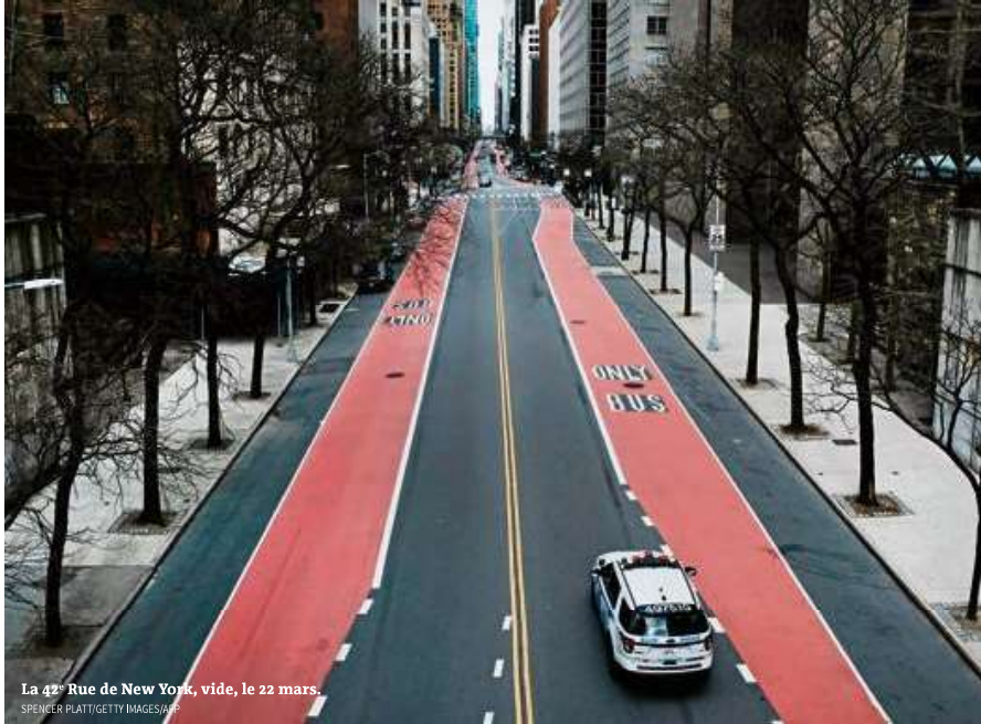
La 42 e Rue de New York, vide, le 22 mars.

► Donald Trump, qui bénéficie de sondages favorables, refuse la moindre critique sur la lenteur de sa réaction