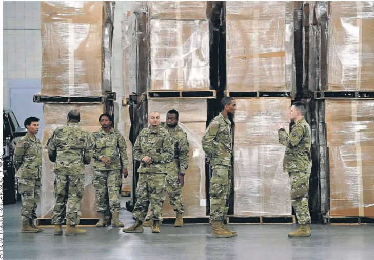
RESCUE MISSION: The National Guard on Monday began preparing to turn the Jacob K. Javits Convention Center in Manhattan into a temporary hospital as New York City's health system struggles to cope with the rise in coronavirus cases.