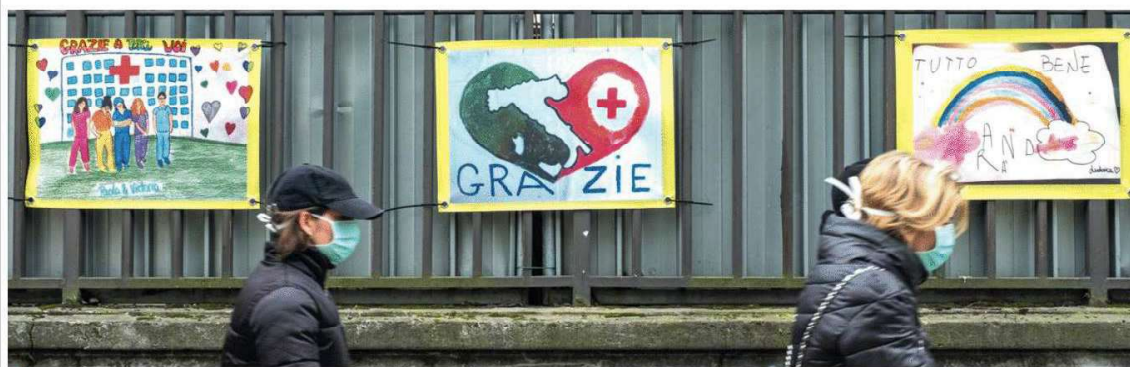
▲ I disegni Milano, davanti al Policlinico messaggi per ringraziare i medici e gli infermieri che combattono il coronavirus

Migliorano tutti i dati. Landini: non obbligateci a scioperare